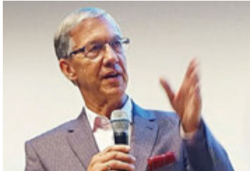
Moderator Dr. Walter Döring, ehemaliger stv. Ministerpräsident des Landes Baden-Württemberg.

Die Auszeichnung „Junge Köpfe“ wird dieses Jahr zum ersten Mal im Rahmen des Demokratiepreises „Württembergischer Köpfe“ unter der Schirmherrschaft des stv. Ministerpräsidenten Thomas Strobl sowie Bundesminister a.D. Cem Özdemir vergeben. Die Veranstaltung moderiert der ehemalige stv. Ministerpräsident des Landes Baden-Württemberg, Dr. Walter Döring.