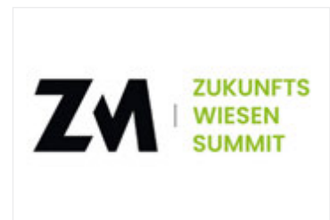
Zukunftswiesen Summit — das Event für Vordenker, Innovatoren und Entscheidungsträger

Preisträger 2025 sind die jugendlichen Leistungsträger des Vereins MS Summit e.V. aus Gerabronn, einem Ort mittendrin in der Region der Weltmarktführer. Mit ihrem Event „Zukunftswiesen Summit“ in Blaufelden für Vordenker, Innovatoren und Entscheidungsträger leisten die Preisträger einen wertvollen gesellschaftlichen Beitrag. Im Fokus der Veranstaltung im Jahr 2024 standen die Themen „Wirtschaftsstandort Deutschland“, „Innovation aus und für die Region“ sowie „Chancen neuer Technologien“. Die Vision der Zukunftsmacher ist „eine Welt, in der jeder Einzelne befähigt ist, aktiv an der Gestaltung einer nachhaltigen und florierenden Zukunft mitzuwirken und teilzuhaben.“